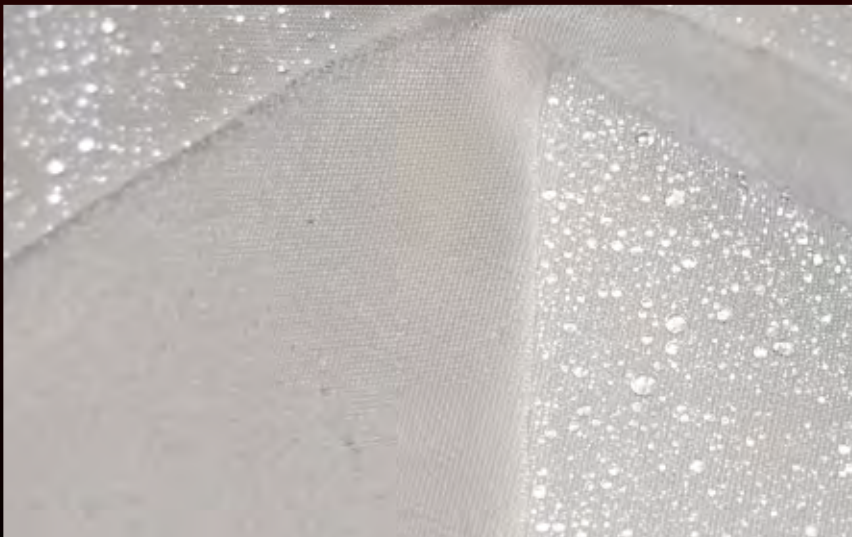
Imprägnierung für langen Schutz gegen Feuchtigkeit:

Oben: Schimmel, Fett & Schmutz Unten links: resistenter Schimmel | Unten rechts: vollständig gereinigt