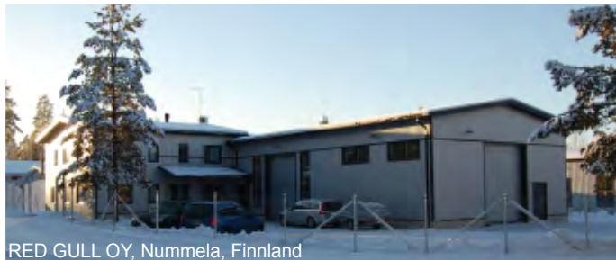
RED GULL OY, Nummela, Finnland

Achtung: Wo sie aufhören, fängt RED GULL an Wenn Ihre Wassersportsaison zu ende geht, machen wir uns an die Arbeit. Bitte bringen Sie uns Ihre Persenninge und Sprayhoods so früh wie möglich. Am besten gleich im Herbst, wenn Ihr Boot ins Winterlager geht. Wir müssen uns über den Winter durch große Mengen an Segeln und Persenningen arbeiten. Je früher wir diese in Angriff nehmen können, desto eher haben Sie sie wieder zurück.