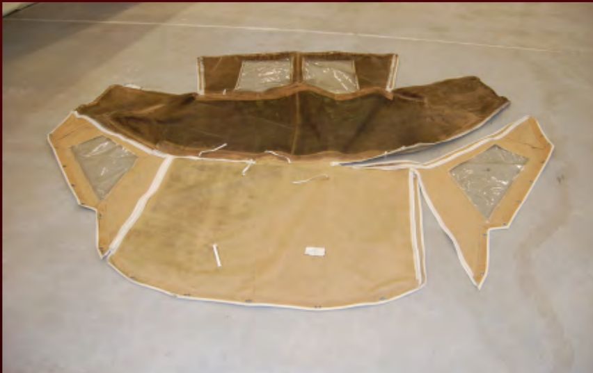
Innenseite einer Persenning in verschiedenen Phasen der Reinigung:

Links gereinigt, beachten Sie die Farbauffrischung alleine durch die Reinigung Rechts: Schimmel. Algen und primär alter Witterungsschmutz