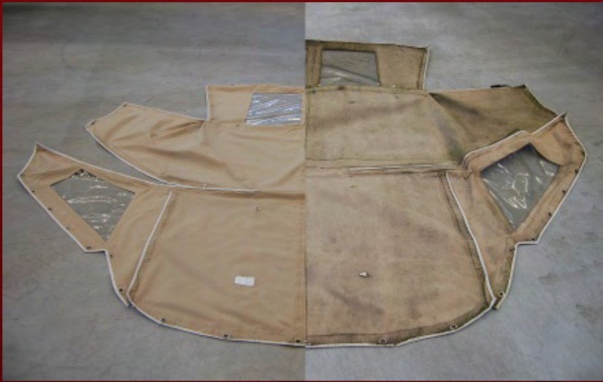
Aussenseite einer Persenning, in einem Vorher-Nachhervergleich

Links gereinigt, beachten Sie die Farbauffrischung alleine durch die Reinigung Rechts: Schimmel. Algen und primär alter Witterungsschmutz